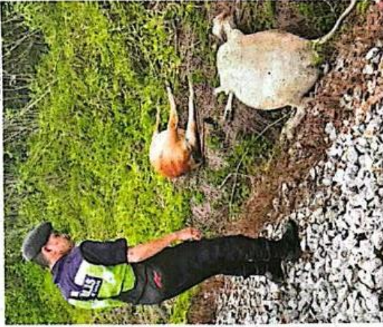
Kesemua 14 ekor lembu ditemui mati akibat pelanggaran dengan tren terbabit.

perlu dilakukan bagi mengelakkan kejadian yang lebih buruk di masa akan datang.