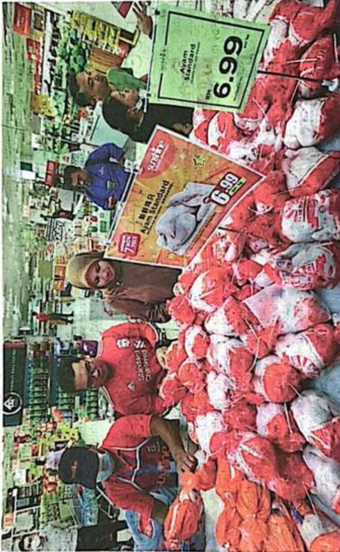
Flocking to the best deal in town: Consumers converging at the chicken section at Sunshine Square. Those visiting the supermarket can buy the birds sold at RM6.99 per kg.