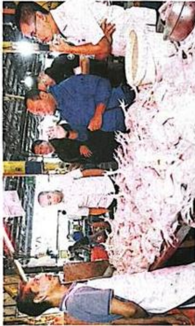
KPKM melakukan pemantauan hari pertama pengapungan harga ayam di sekitar kawasan Selangor, Negeri Sembilan serta Putrajaya pada Rabu.

Menterinya, Datuk Seri Mohamad Sabu bagaimanapun menjelaskan, subsidi serta kawalan harga bagi telur ayam gred A, B dan C akan diteruskan mengurulan mekanisme sedemikian.