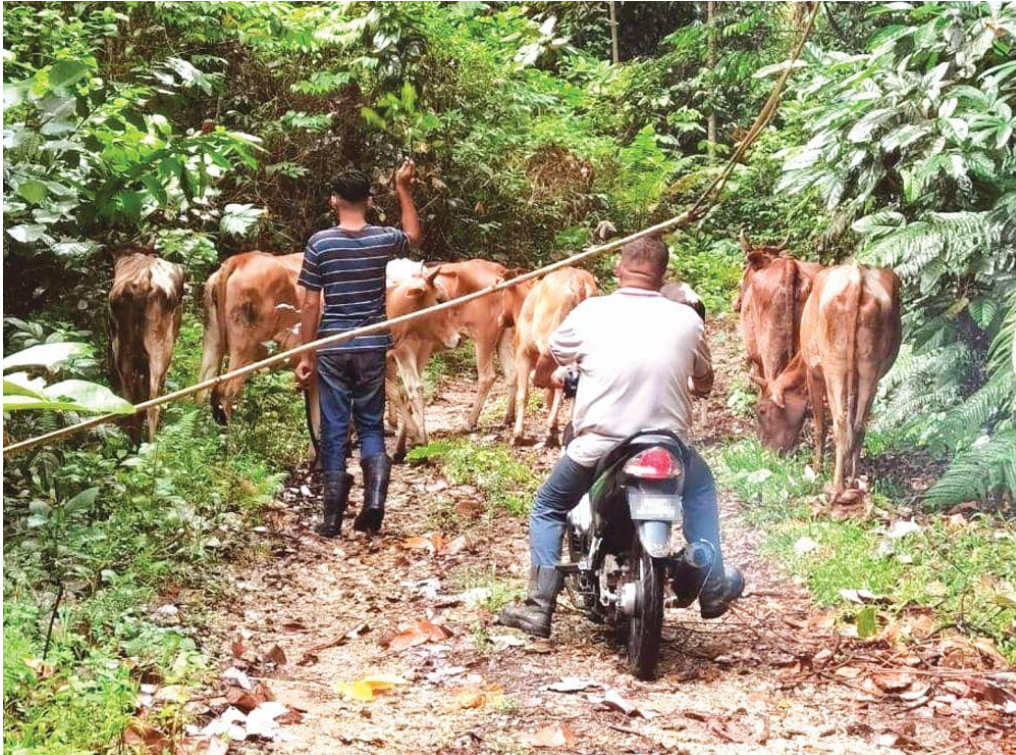
PENTERNAK menjaga lembu ternakan mereka di Kampung Jahang, Gopeng setelah wujud kebimbangan mengenai kemunculan harimau belang di kawasan tersebut.

GOPENG: Seorang penternak lembu di Kampung Jahang di sini mendakwa kerugian RM15,000 apabila enam ekor ternakannya mati dipercayai dibaham harimau belang.